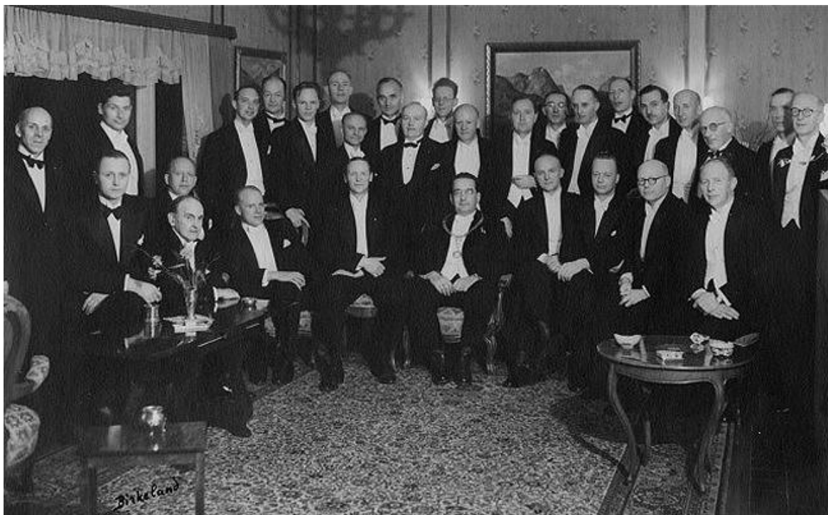
Gruppebilde fra charterfesten