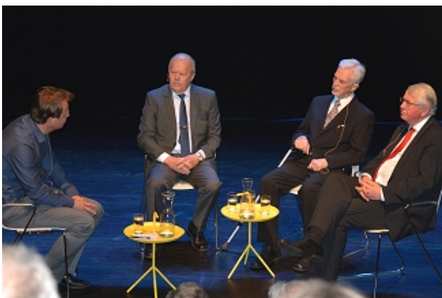
Her som samtaleleder