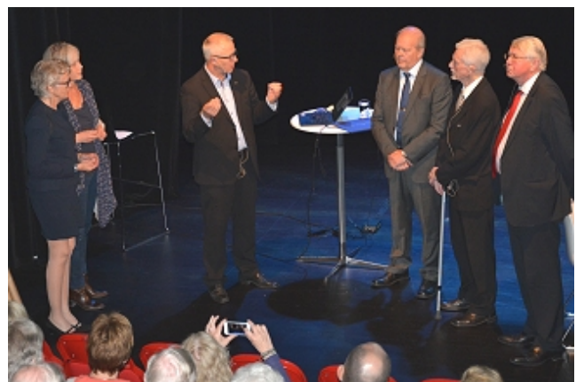
Paul Harris-nåla deles ut