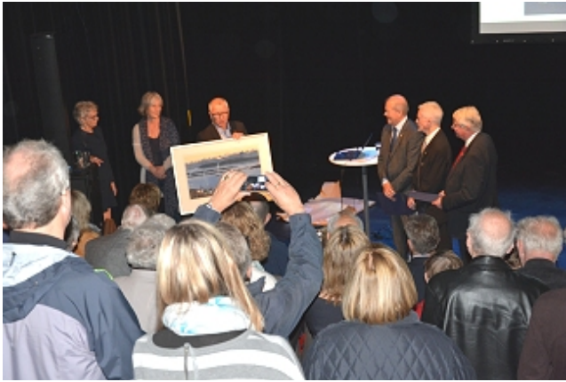
Et Lars Istad-trykk hørte med