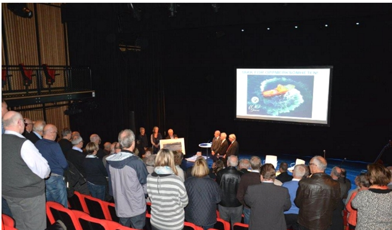
Mange hadde funnet veien til Teatret Vårt/Plassten denne kvelden