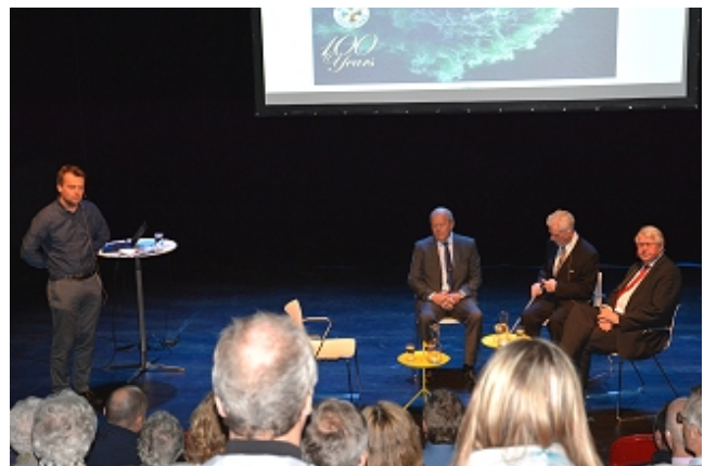
Loe Welde om RB