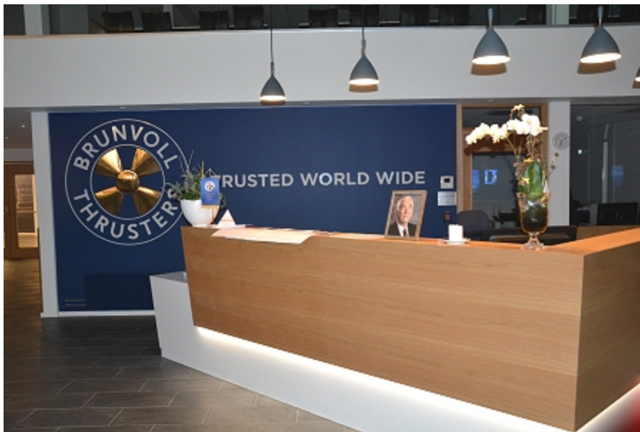
Vestibyle med foto av nylig avdøde Oddmund Brunvoll