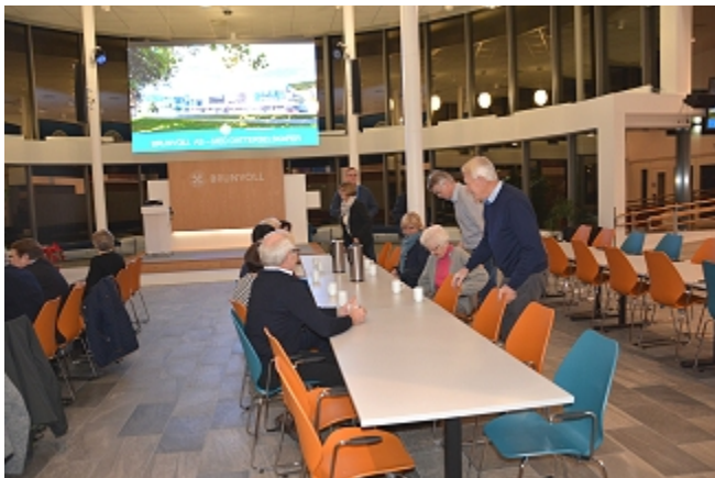
Forsamlingen benker seg