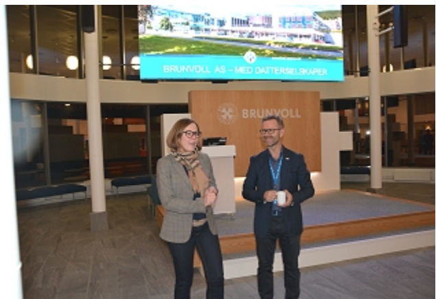
President og direktør