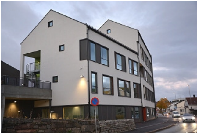
Bygningen Øvre vei