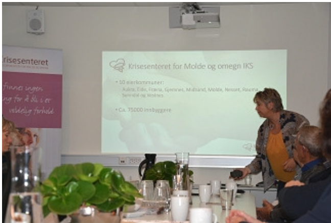
Vi er i gang