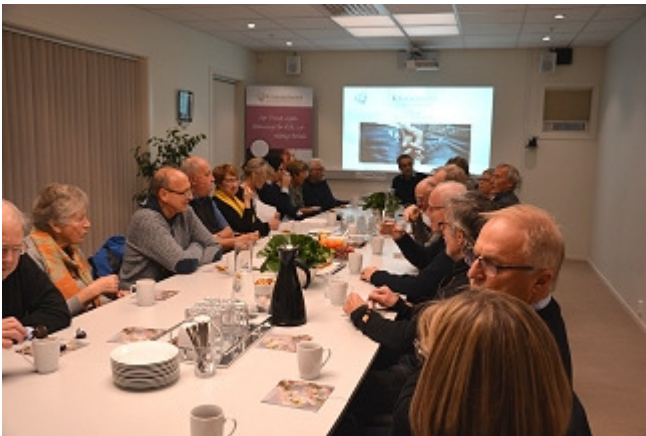
En lydhør forsamling