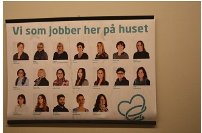
De som jobber i huset