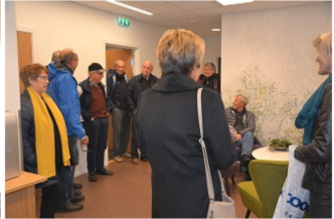
Samling i foajeen