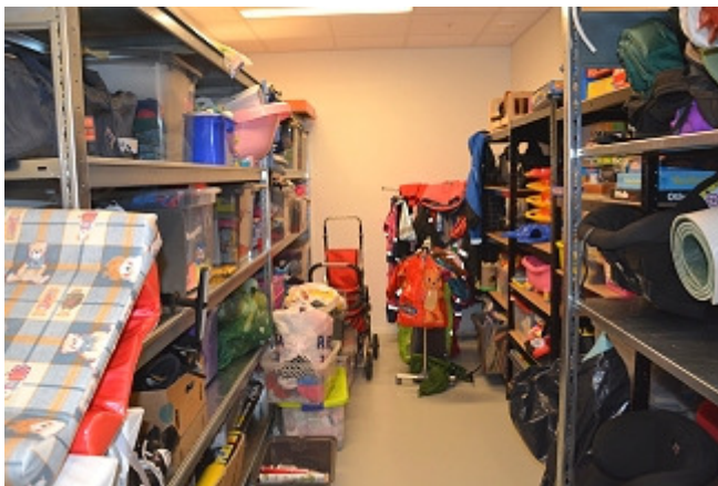
Et lite lager