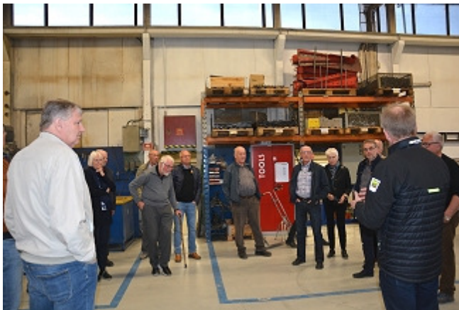
Omvisningen har begynt