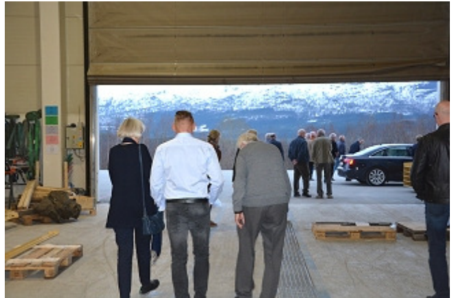
Tid for hjemvei. Takker!