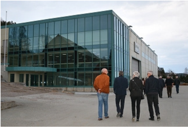
Nybygget mot øst