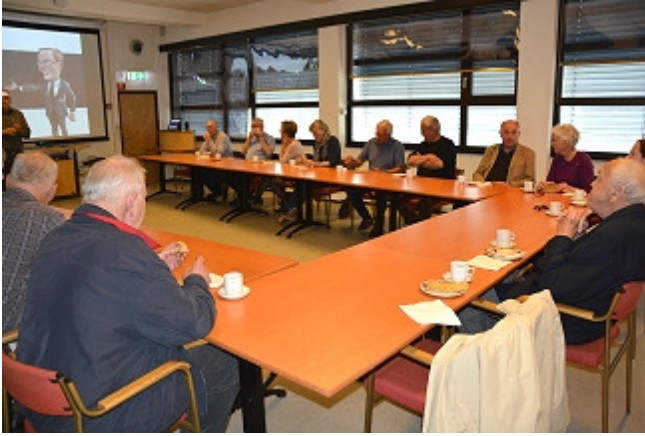
Kaffe, vafler og orientering