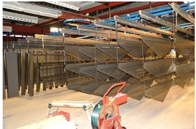
Produkt som tørkes etter behandling