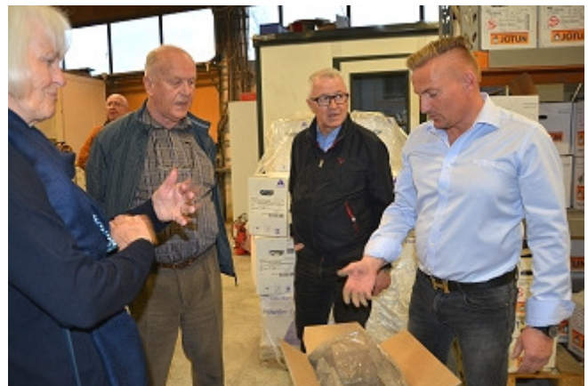
Farger i pulverform vises