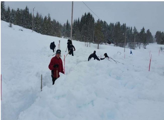
Mye snø måtte ryddes før byggearbeidet kunne starte. Bildet ble tatt 4. april!

Reising av selve bygget skulle starte senere samme høst, men ble av ulike årsaker utsatt til våren 2018. En svært snørik vinter gjorde det nødvendig med to dugnader for å rydde tomte og ivrige rotarymedlemmer gikk i gang med snøfresere og spader.